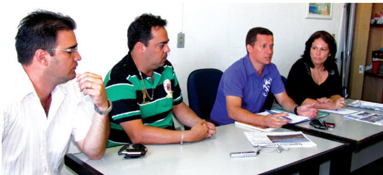
Os quatro presidentes dos sindicatos em encontro realizado em São Sebastião.