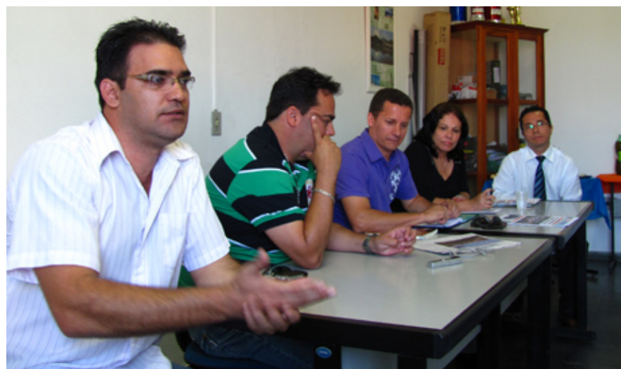
Presidentes dos quatro sindicatos durante encontro em São Sebastião

Os sindicalistas também já estão em fase de negociação salarial da categoria. A média de reivindicação deve chegar à casa dos 20%